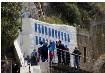
Inaugurazione del Muro dei Migranti Martedì 3 maggio 2022