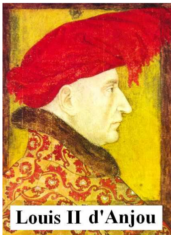
Louis II d'Anjou

Malgré leur premier échec, les cardinaux pisans se réunissent à nouveau en conclave et élisent Cossa le 17 mai 1410 sous le nom de Jean XXIII.