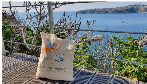
Le Mur des Migrants – mars 2022

Il rend hommage à ces hommes et ces femmes, à leur courage et à leur détermination, pour tracer un nouveau destin pour eux et leurs familles en émigrant vers d'autres contrées. Les noms de nos ancêtres migrants sont gravés sur une plaque apposée et visible sur le Mur physique, complété par un Mur numérique, rendant accessibles en ligne leurs histoires individuelles.